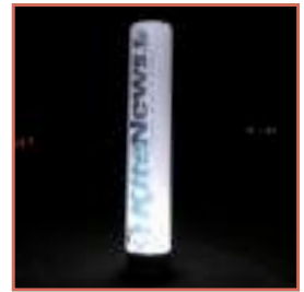
Rétro éclairage LED en option pour les événements nocturnes