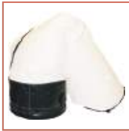
Monobloc souple 100% cousue pour éviter les matériaux rigides