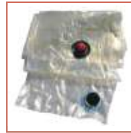
Chambre à air en PU 110 micros avec système « easy change »