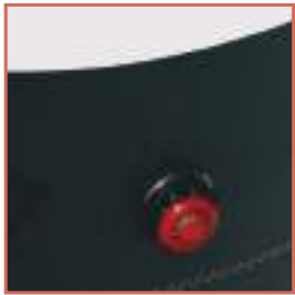
Structure en polyester et PVC équipée de valves de surpression